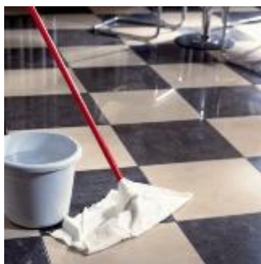
Mild Stone Soap